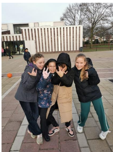
Dansje op het plein

Groep 7 vindt kleuren en tekenen erg leuk. Eigenlijk zouden we elke dag wel willen tekenen. We vonden het superleuk toen we extra kunst-les hadden van de stagiaires van de Willem de Koning academie. Het ging over Vincent van Gogh en kleuren mengen. We waren net kunstschilders die dag!