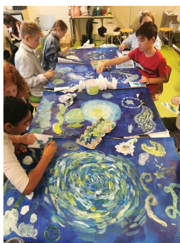
Vincent van Gogh les