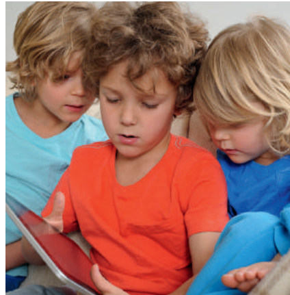
Tijdens het spelen raken de hoofden elkaar en kan hoofdluis zich verspreiden.

Hoofdluis heeft niets te maken met wel of niet schoon zijn. Het kan iedereen overkomen. Hoofdluizen lopen via het haar over van hoofd naar hoofd. Hoofdluizen zoeken graag een warm plekje op; bijvoorbeeld in het haar achter de oren, in de nek of onder een pony. Kinderen krijgen gemakkelijk hoofdluis, omdat tijdens het spelen de hoofden elkaar soms raken. Hoofdluizen verspreiden zich ook makkelijk bij pubers. Dat kan bijvoorbeeld gebeuren bij het knuffelen, samen selfies maken of bij elkaar op de mobiel kijken.